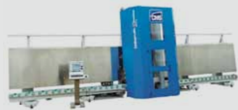
Centro di lavoro verticale "Profile 45/28" lastre sagomate e piccole serie speciali