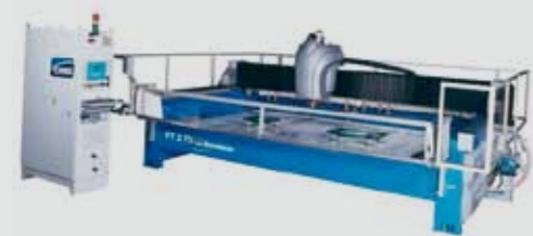
Centro di lavoro "FT 6.73" per operazioni su cerchi, ellissi e piccole lastre