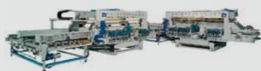
Centro di lavoro "FuturaP55/26" per vetrate strutturali e per arredamento sfilettatura e molatura