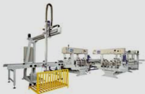
Centro di lavoro bilaterale "Futura" per operazioni di sfilettatura e molatura