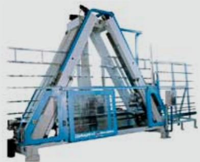
Macchina "Deltagrind" per sfilettature su vetrocamera e temprati