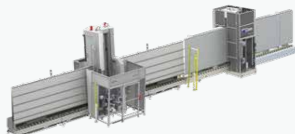
YPSOS型 + VERTEC MILL型