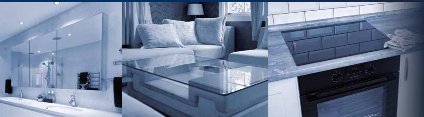
镜子 | 桌子 | 烤炉及灶台