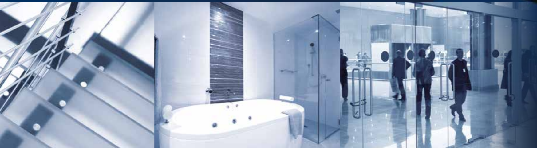
门 | 楼梯 | 浴室台面